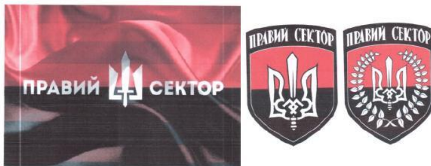
Рисунок 11. Атрибутика организации «Правый сектор».