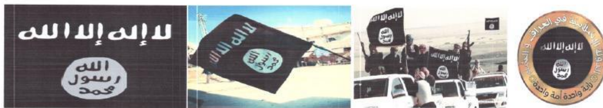
Рисунок 12. Символика организации «Исламское государство».